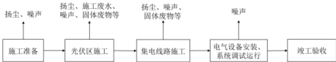
图 2-2 施工工艺流程图及产污环节图